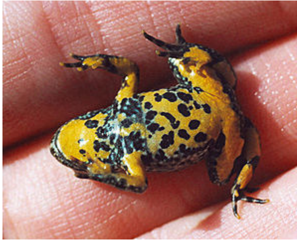
Bombina variegata iuvenilis (quae supinata est, ut apparent colores ventris).