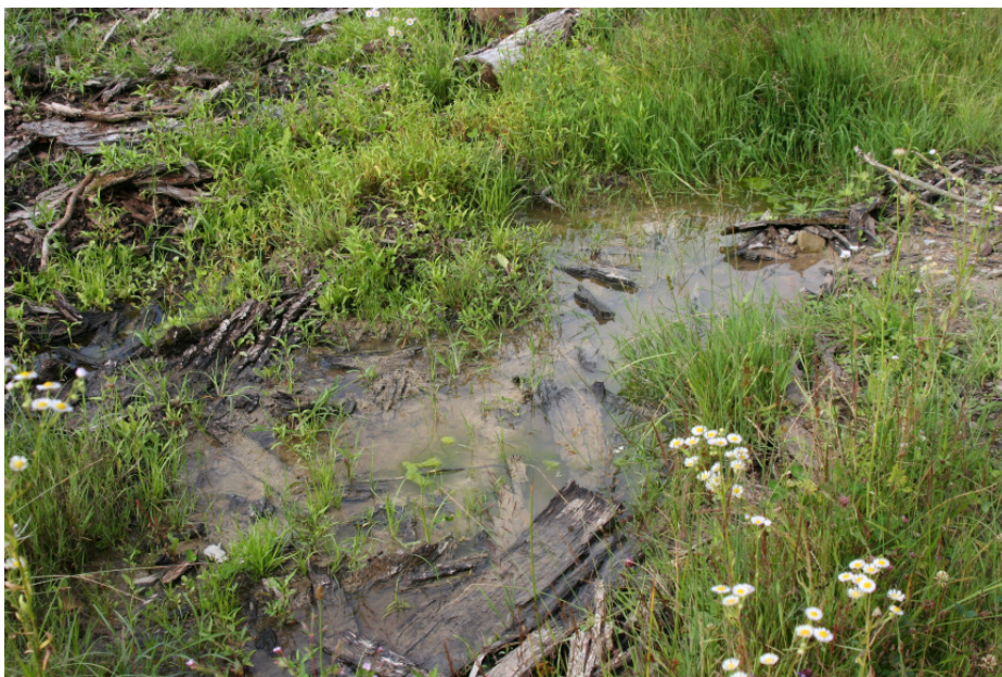
Habitatio Bombinae variegatae typica (Badenio-Virtembergensis)