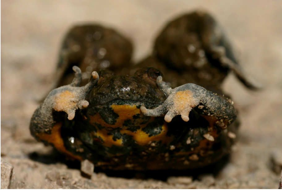
Ecce positio lintriformis (quae similis est lintri). Quâ positione terrore effectâ praedatores monentur de veneno Bombinae variegatae cutaneo.