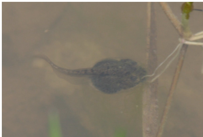
Ecce gyrinus Bombinae variegatae