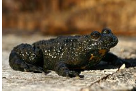
Ecce exemplum Bombinae variegatae valde nigratum!