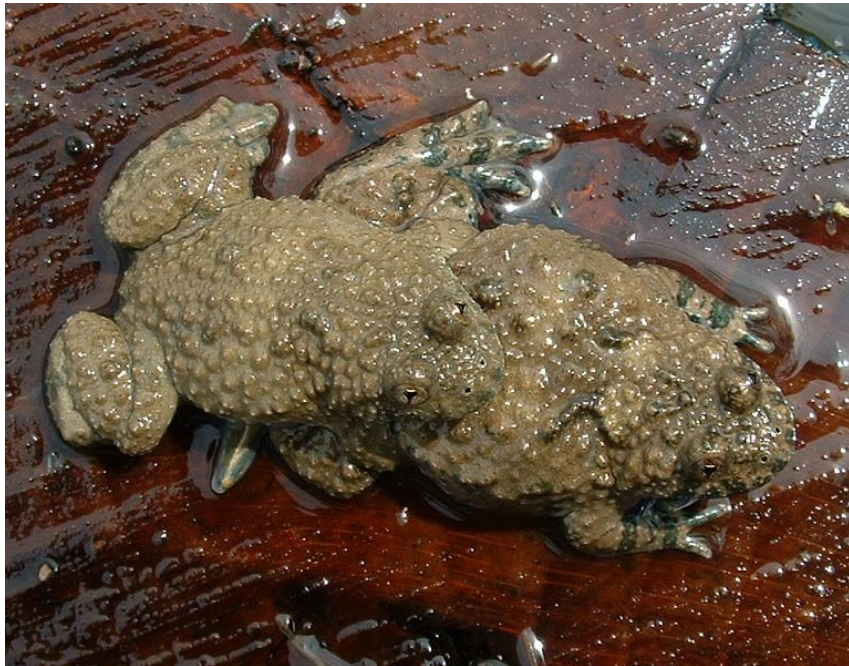
Ecce amplexus lumbalis maris et feminae Bombinae variegatae .