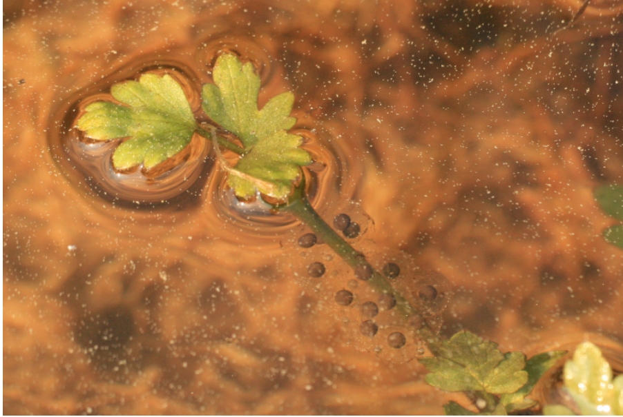
Ecce ovula Bombinae variegatae stilo plantae affixa.